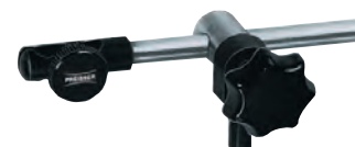
Messuhrenhalter dreh- u. schwenkbar